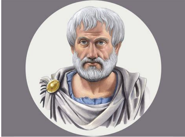
5 Wetten van Aristoteles